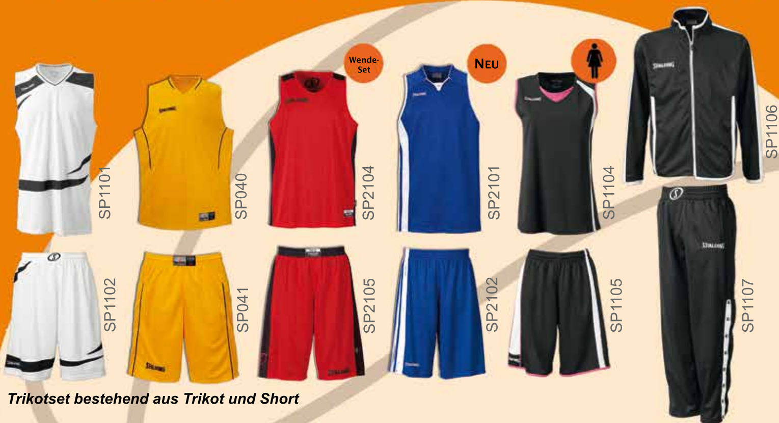
Trikotset bestehend aus Trikot und Short